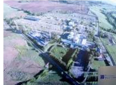
Vista dall'alto del CR di Roma Nord

Per mantenere altamente performanti gli impianti e le tecnologie presenti nell'edificio del CR è stato necessario incrementare l'affidabilità e la sicurezza di componenti essenziali (come il sistema UPS, batterie incluse), potenziare il sistema di alimentazione di emergenza con gruppi elettrogeni di taglia maggiorata e completare, con il ricollaudo, il sistema antincendio delle sale CED.